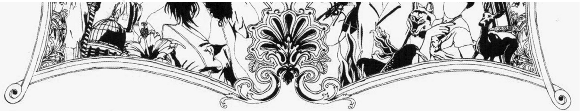
NEVER EFFECT, untitled Détails